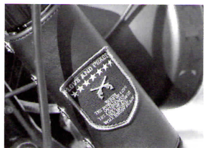
このマシンのフロントにはストーツ製49ミリフォークが装備されているのだが、その上部に革製のフォークカバーを装備。サイドのデザインも当然roarのものだ。