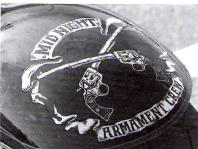
リアフェンダーは以前のモノをモディファイした上でペイント。交差するガンはroarのシンボルマークでもある。「MIDNIGHT〜」の今後にも注目して欲しい。

イカーから脱却したい貴方、この「MIDNIGHT ARMAMENT CREW」に加入してみては? (注:あくまで架空のクラブ、という設定ですので、ホントはメンバー募集などはしていません。あしからず) しかし今年ほどご行っても不況だ厳しいだという辛気くさい話ばかりであったが、そんな中、こういう業界が活性する動きがあるというのはウレシイ限り。いや、お世辞でも何でもなく筆者アッキーは、「セレクトッドさんはそのうち何か面白いことやってくれそう」気がしていたのだが、ホントにやってくれちゃいました。昔ながらのスタイルも悪くないけど、それに縛られてしまうというのなんかおかしい。チョッパーってのももっと楽しむもんであって、こんなファッションして乗らなきゃいけない、なんて決まり事はないはず。つーことでこのコラボはひとつの提案として見て欲しい。