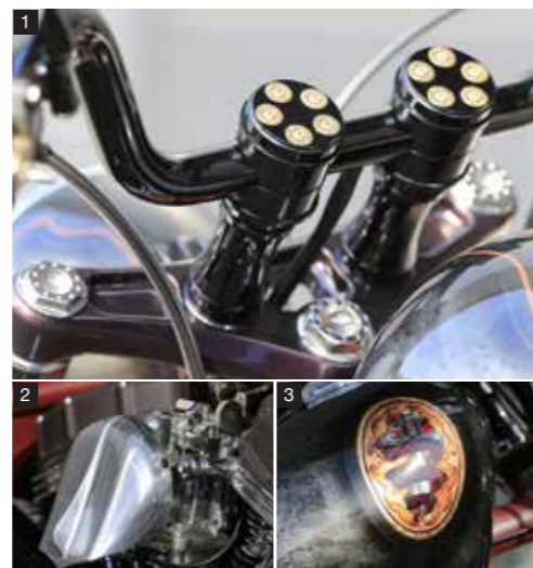
1: オリジナルのOWLバーハンドルに、アルミの削り出しのHOOKライザー4インチを装着。リボルバーの弾倉を模したヘッドパーツを合わせる 2: ミクニ製HSR42にサイレンカバーをモディファイしてエアクリカバーにしている 3: ペイントはナチュラルの作品。「ROYAL SWAGGA GRANDLY URBAN STYLE」のレタリングが表すように、快適に街乗りできる走行性能を備える。排気量は1550cc、アンドリュース製TW26カムでパワーアップ。燃焼室で圧縮比を下げ、ストップ&ゴーが多い街乗りに対応

指した。エンジンは街中でも扱いやすいパワーフィールを追求。シャシーは、スポーティなダイナのフレームを生かしながら、リアまわりをワイド化した。特筆すべきは、フレームとスイングアーム、電装系の複雑な位置関係をスマートに見せつつ、メンテナンス性を向上させたバランスよいスタイリング。圧倒的な個性を放ちながらも、スマートなフォルムにまとめている。