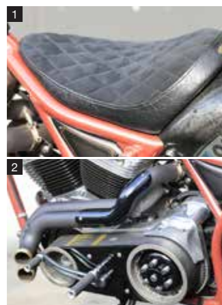
1: 素材の質感を生かしたダイヤモンドステッチ入りのソロシートはSCM製オリジナル 2: ワンオフの2本出しマフラーは、右サイドからエンジンを囲むように左サイドへ取り回し、オープンブライマリーに沿って前方へ向かってレイアウト