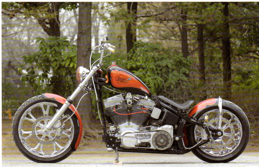
セレクトッドの一貫した姿勢を感じさせるこの一台は、ストックフレームをベースにカスタムされたマシン。じつに秀逸な出来映えだ。