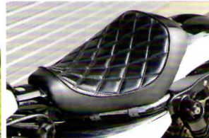
ダイヤステッチの入ったシングルシート。シンプルなスタイリング作りに貢献している