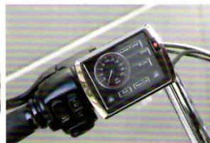
ダイノジェットのパワーメーターを装着。メーターの他アクセル開閉度などが表示される