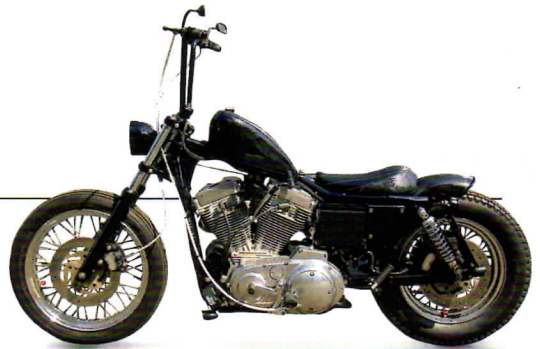
▶ Bike Image