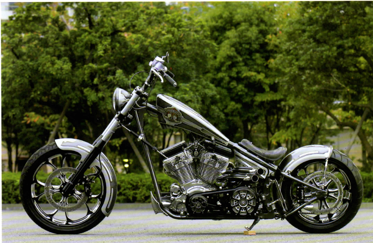
同店の手掛ける「ROYAL」シリーズの最新作となるこの一台。ブラックとシルバーを基調とすることで、高級感を演出している。